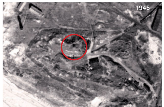
Jahrzehntelang waren Reste der Seefestung in den Borkumer Dünen allgegenwärtig. Auch heute noch kann man sie vereinzelt finden.

Angesichts der enormen Zerstörungen in den Dünengebieten durch das Militär mutet es heute wie ein Wunder an, dass die Natur die Größe der Insel in den darauffolgenden Jahren nicht durch Ausblasungen und durch Sturmfluteinwirkungen auf ein Minimum reduziert hat. Denn seit den späten 30er Jahren war auch in Sachen Hochwasserschutz auf Borkum nicht viel passiert und es wurde ganz offensichtlich hierfür nur das Nötigste unternommen. Dafür hatte man die Schaffenskraft von zahlreichen Arbeitern und Kriegsgefangenen auf die Erstellung und Erhaltung einer waffenstarrten Dünenfestung ausgerichtet.