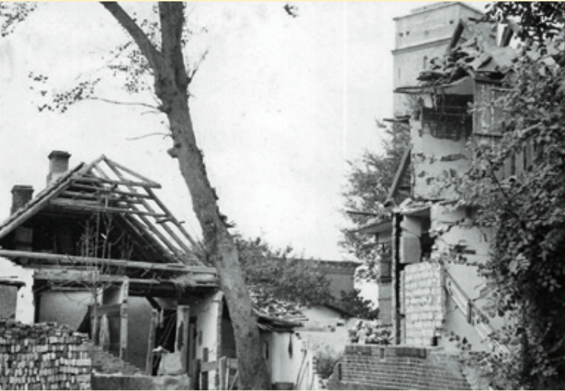
Bereits 1941 fielen erste Bomben auf das Inseldorf. Sie trafen zwei Wohnhäuser in der Ortsmitte beim Alten Leuchtturm.

Text: Gerd Kaja